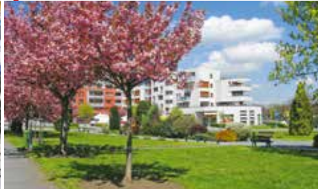
Tyršovo náměstí v roce 2016