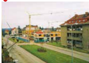
rok 2002 – sektor A