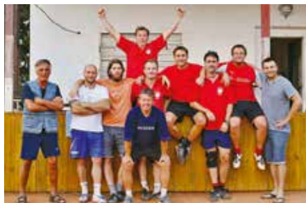
Vítězné družstvo pražské soutěže

V Praze-západ družstvo vyhrálo základní skupinu a v nadstavbové části skončilo se shodným počtem bodů na druhém místě.