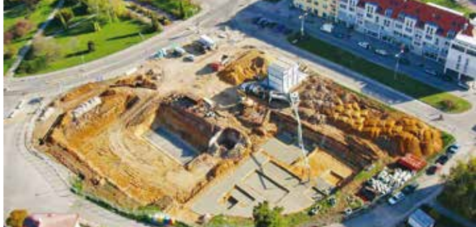
rok 2005