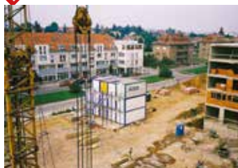
rok 2005 – výstavba sektoru B