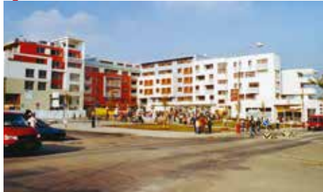
rok 2006