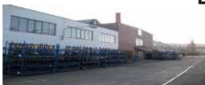
Koever CZ - Libčice nad Vltavou – Česká republika s tradicí od roku 2006