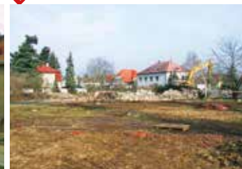
rok 2003 – bez kina