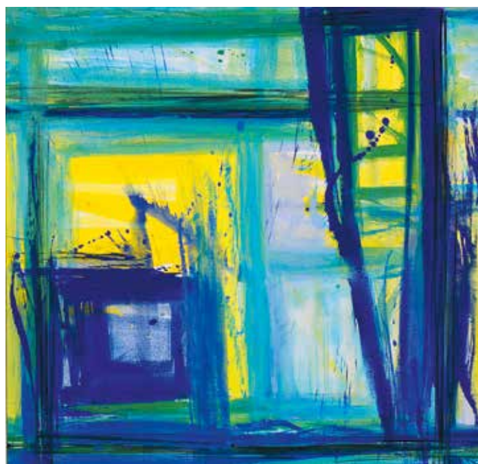
Kompozice, Sybille Proksch