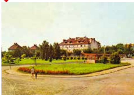
60. – 70. léta (archiv web)