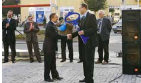
13. října 2006 bylo Tyršovo náměstí slavnostně předáno městu a občanům. Zároveň zahájila provoz prodejna Albert (archiv SMR)