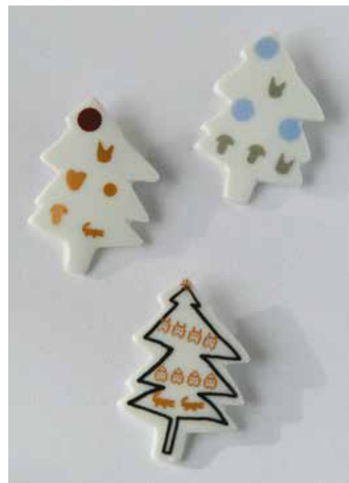
Porcelánové brože, Petr Hůza