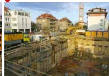
rok 2006 stavební jáma hotelu Academic