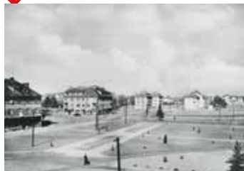
rok 1955