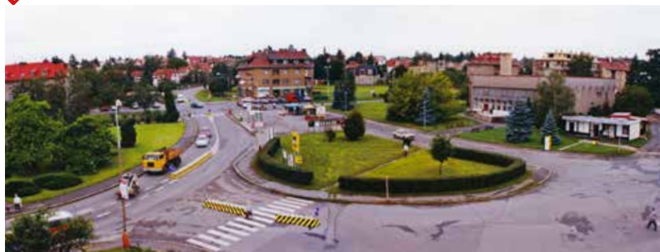
rok 2001