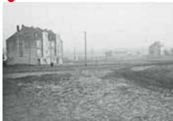
kolem roku 1937