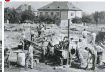
stavba kina 1961 (archiv MK)