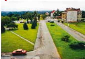
rok 2001