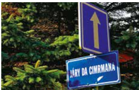
Ulice Járy da Cimrmana, současný stav

V nedávné anketě o „největšího Čecha“ s převahou (předběžně) zvítězil lidovým hlasováním virtuální génius Jára da Cimrman. Organizátoři ankety však neunesli takový příval spontánního humoru a tohoto velikána, jehož všestrannému talentu se smějeme už 50 let, diskvalifikovali a ze soutěže vyřadili, což otevřelo cestu na piedestal císaři a králi Karlu IV., který byl ovšem etnickým Čechem tak nejvýše z jedné čtvrtiny.