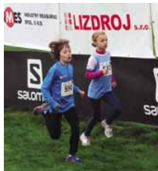
Závod „Přes Motolské jamky“ 2014