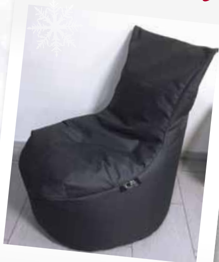
Sedací vak Stopka