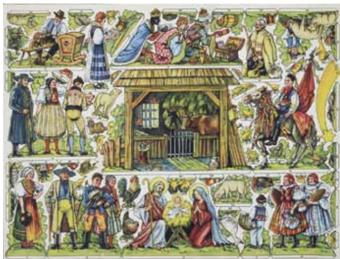
Reklamní betlém (arch) na kávu Karo-Franckovka, ze sbírek Středočeského muzea v Roztokách u Prahy