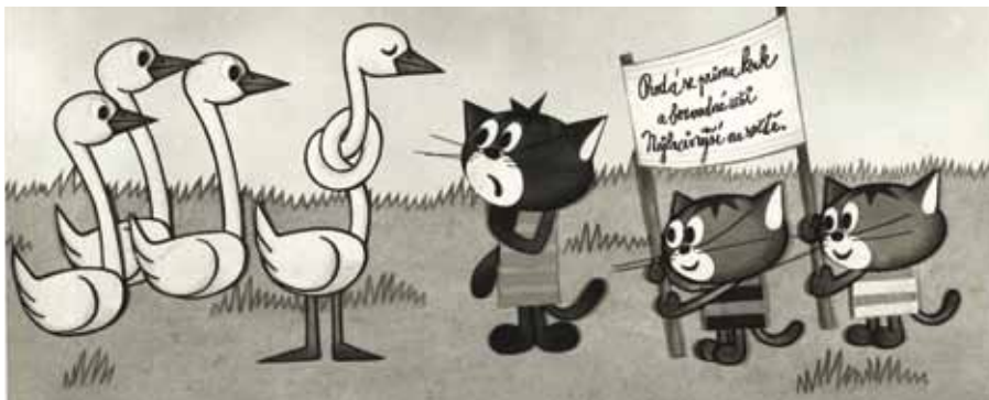
Byla jednou koťata – výtvarník Josef Váňa , režie Ladislav Čapek