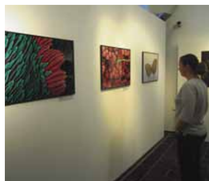
Na výstavě Tajemství rostlin