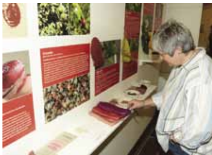
Z výstavy Barvířské rostliny

V prostorách Galerie/Kabinetu stále probíhá výstava z říše rostlin. Návštěvníci zde získají celou řadu zajímavých informací o historii barvení rostlinnými barvivy i o jednotlivých rostlinách a jejich použití, a to včetně ukázek vzorků barvených tkanin. Výstava je to vskutku pestrobarevná a nechybí na ní hravý koutek pro děti!