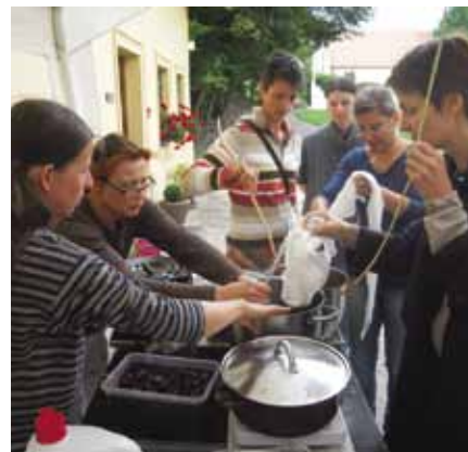
Ze srpnové Barvířské dílny