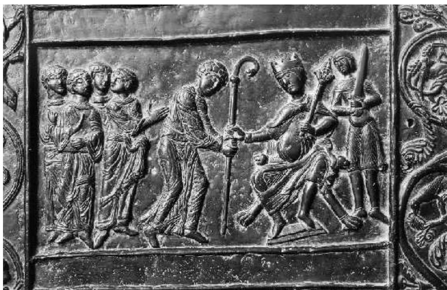
Vojtěch přijímá z rukou římského císaře Oty II. berlu, jako odznak biskupské moci (hnězdenská vrata, pol. 12. století).

Po peripetiích se stavební firmou, která celou výstavbu Na Panenské II zpozdlila o více jak 2 roky, poté, co se domáhají dokončení základní vybavenosti objektů