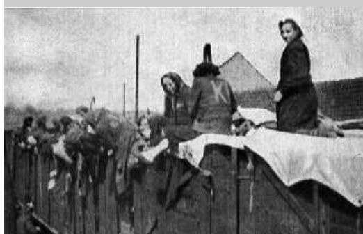
Ženy-vězeňkyně volající o pomoc a jídlo