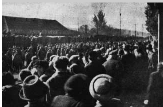
Stovky občanů Roztok a okolí na roztockém nádraží odhodláni pomoci vězňům transportu

Historii událostí okolo Transportu smrti v Roztokách nejlépe dokládají autentické fotografie: