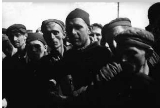
Skupina vězňů, kterým bylo umožněno vystoupit z vagonů a vyhledat pomoc lékařů