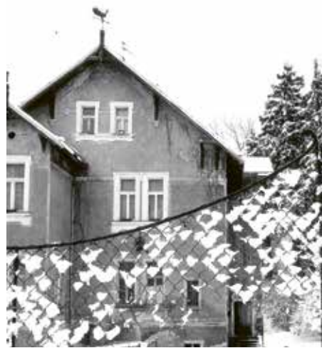
Lenhartova vila čp. 124 v Tichém údolí, zvaná „dům s kohoutem“, 1976

Po roce 1989 převedl stát (ONV Praha-západ) na město Roztoky několik vil v Tichém údolí, které byly dosud zapsány na katastru jako majetek československého státu. Jednalo se vesměs o bývalý židovský majetek. Většinou, s vnitřními úpravami na menší bytové jednotky, sloužily k nájemnímu bydlení. Ve vile Amálka, čp. 155, byl zřízen dům s pečovatelskou službou, v luxusní vile Alice, čp. 192, byly umístěny městské jesle a mateřská školka a také sídlo Městského kulturního střediska.