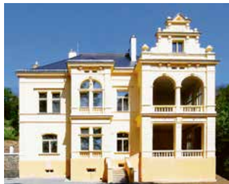
Průčelí vily, květen 2020

O tzv. Haurowitzových vilách se už napsalo v minulosti mnoho, ať už byl důvodem jejich katastrofální stav, pohnuté osudy majitelů nebo zahájení generální rekonstrukce.