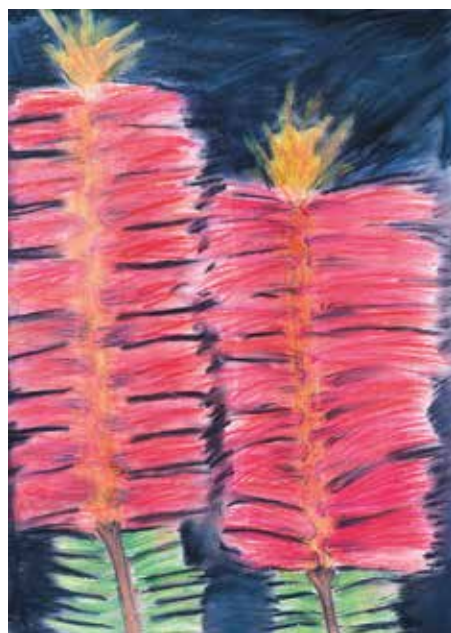
Z CYKLU AUSTRÁLIE, pastel. Aneta Pánková, 10 let

INFORMACE, REZERVACE, ZÁVAZNÉ PŘIHLÁŠKY: lada.kk@post.cz , +420 725 069 062