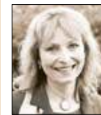
Vladimíra Drdová radní pro školství a sociální věci

Nebojte se upozornit a nestyďte se za problémy. Stát se to může nám všem. Důležité je problémy řešit a nedělat, že tu nejsou. Naše děti za to stojí, nejen ty malé. I ty velké. S naší pomocí mají šanci!