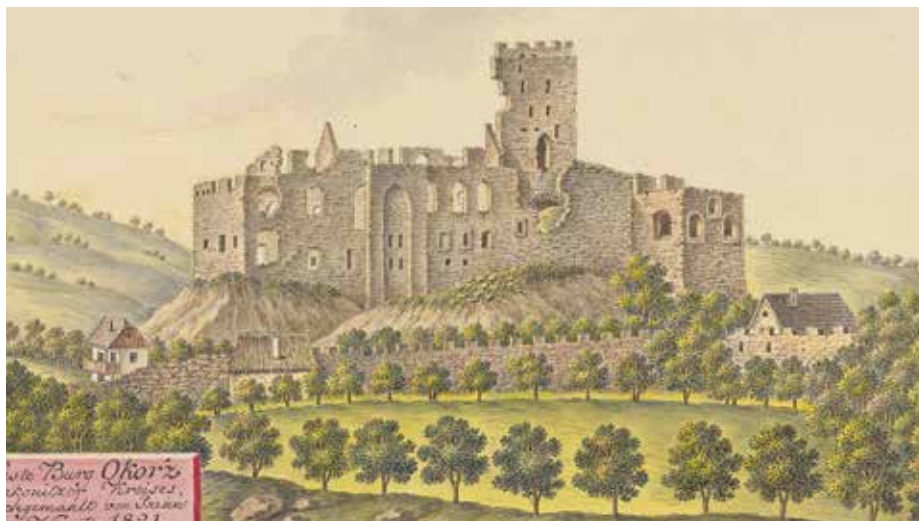
Jan Antonín Venuto, Hrad Okoř, akvarel, 1821

Podtitul výstavy Půvab krajiny středních Čech na přelomu 18. a 19. století přesně