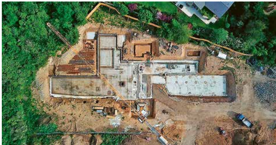
Staveniště nové školy z ptačí perspektivy

Vážení spoluobčané, svět se pomalu vrací do dřívějších kolejí. Bohužel virus se nevyhýbá ani našemu městu. Proto musela být v minulých týdnech uzavřena MŠ Spěšného. Doufám, že se již situace nebude zhoršovat. Držme si palce!