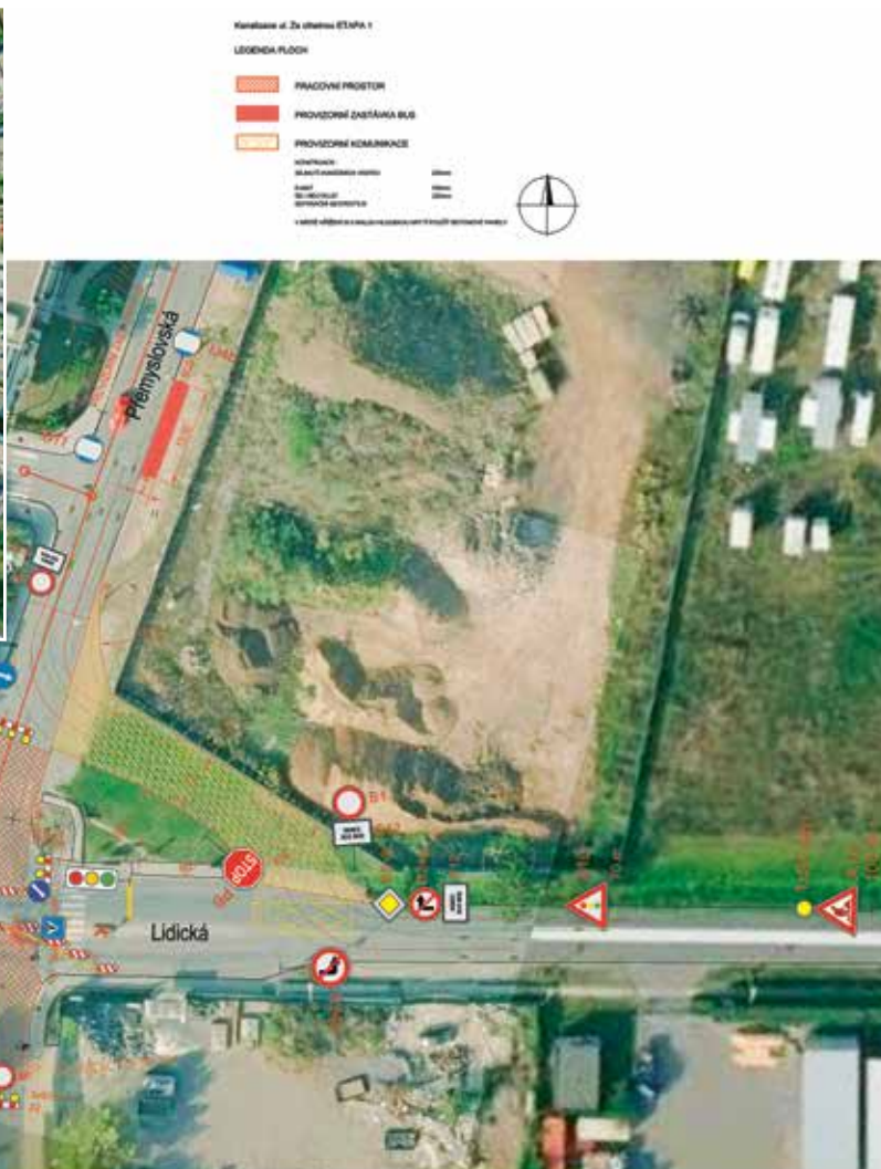
Kanalizace ul. Za cihelnou ETAP 1