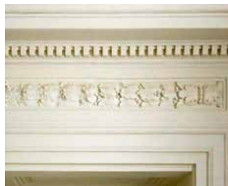
Obnovená balustráda a táflování v původní jídelně