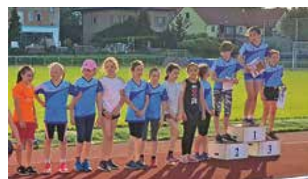
Vyhlášení kategorie starší přípravy – děvčata

Již v předvečer závodů přípravků se uskutečnily závody atletických družstev dospělých Středočeského kraje, ve kterých zvítězilo v nelehké konkurenci naše družstvo žen a jen těsně druhé místo za družstvem