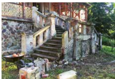
Stav schodiště těsně před rekonstrukcí, po odstranění rostlé vegetace, 2019

Mám však zvláštní vzpomínky na léto 1938. Přestože před námi nikdo z dospělých nepromluvil o hrozbě německé invaze, všimla jsem si, že došlo k určitým změnám.