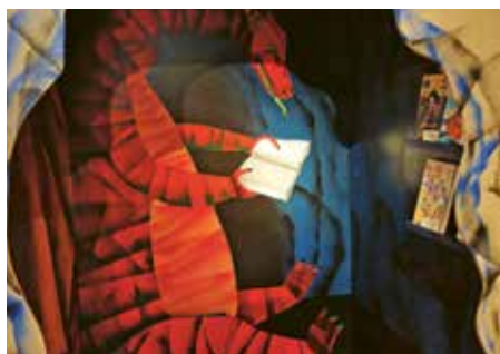
Drak Šmak ve výstavě Ještě jednu stránku, prosím...