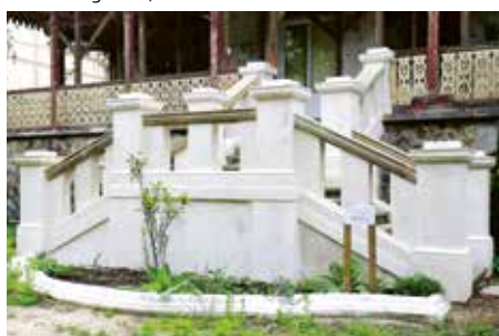
Zrestaurované schodiště vily čp. 110, květen 2020