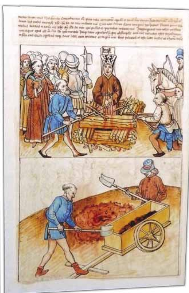
Vyobrazení z Kroniky Oldřicha z Richentalu (1464)