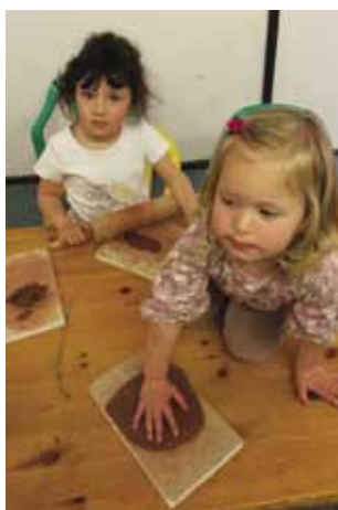
Keramické tvoření v kroužku Sluníčka

O více informací si pište na centrumrozalek@seznam.cz či volejte na číslo 773 245 147.