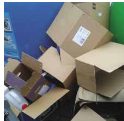
Stanoviště prázdných kontejnerů hodinu po vyvezení: