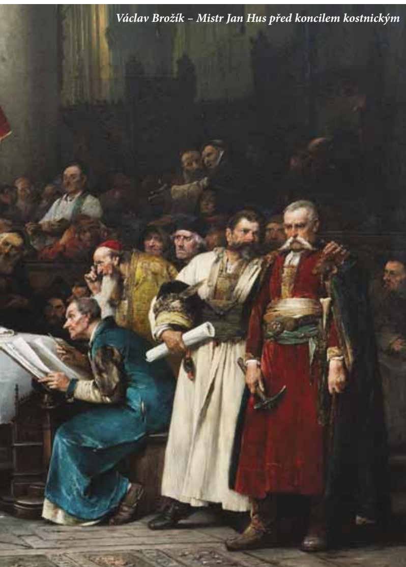
Václav Brožík – Mistr Jan Hus před koncilium kostnickým