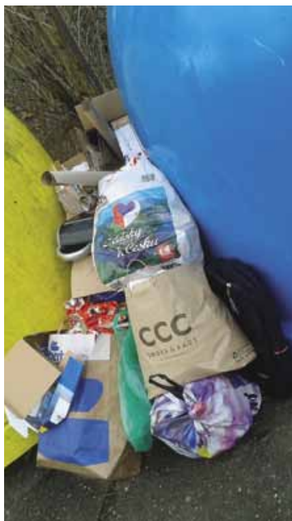
Z lásky k Česku