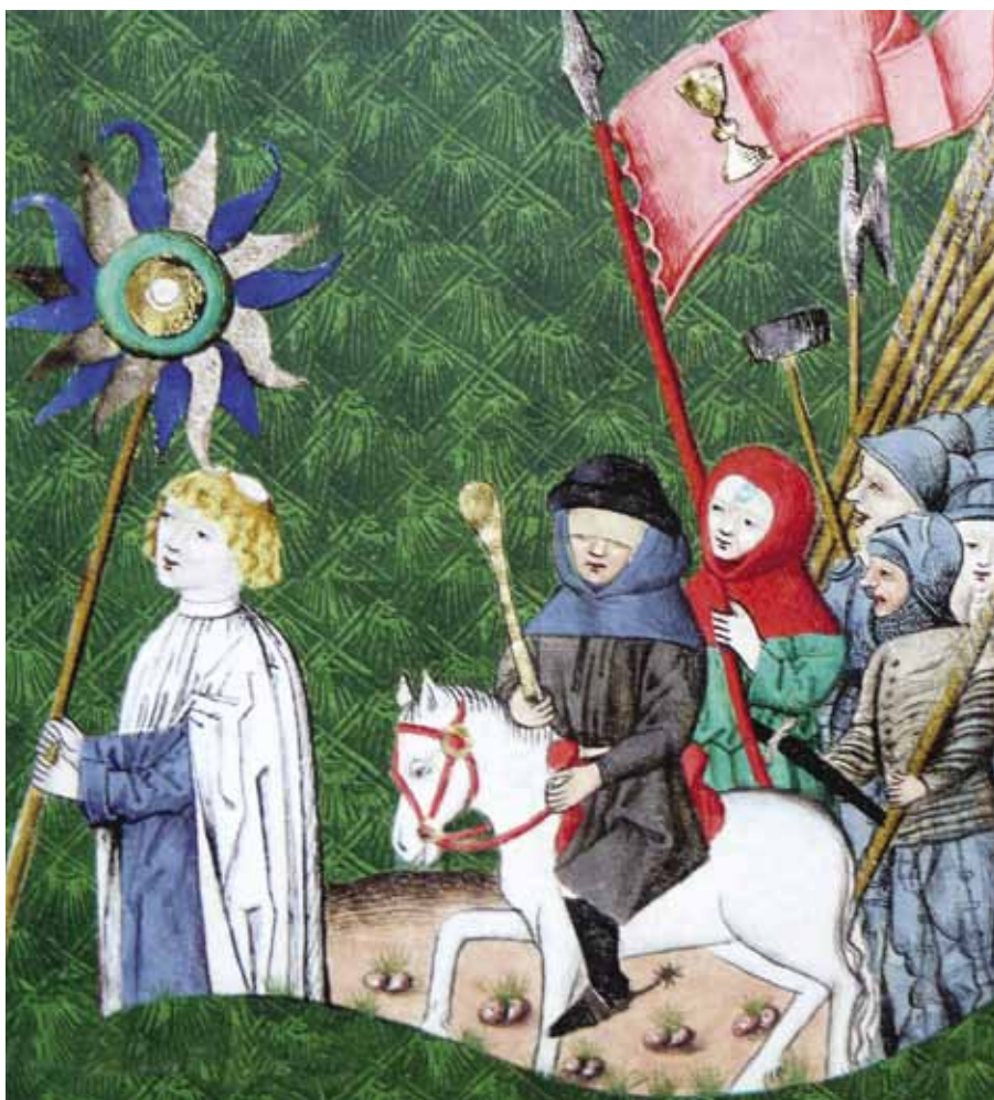
Jan Žižka v čele husitských vojsk (Jenský kodex – konec 15. stol.)