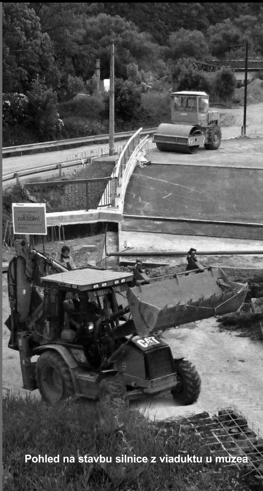
Pohled na stavbu silnice z viaduktu u muzea