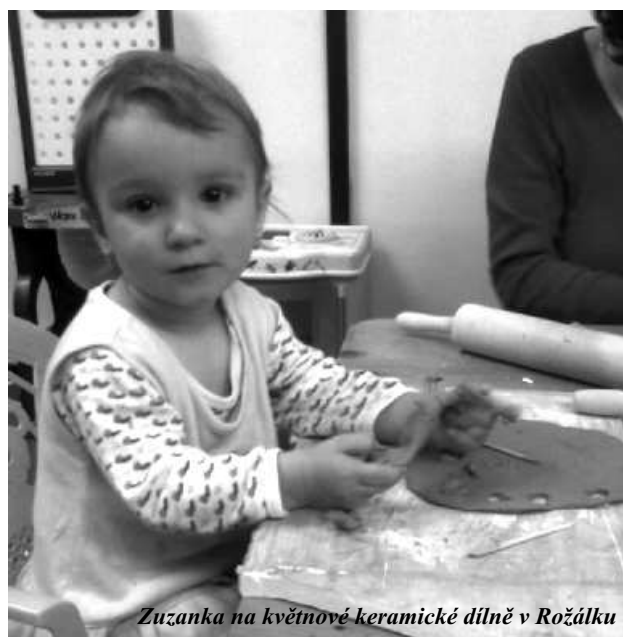
Zuzanka na květnové keramické dílně v Rožálku

V červenci a srpnu bude prostor herny uzavřen. Rozhodly jsme se následovat rožálkovskou prázdninovou tradici a setkávat se při společných výpravách po okolí Roztok. Pokud máte zájem o více informací k výletům, nechte nám na sebe v Rožálku kontakt a my se Vám v létě ozveme. Chystáme se zopakovat například vloni úspěšnou návštěvu farmy s jízdou na koních pro děti.