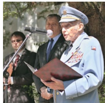
Legendární letec plukovník Pavel Vranský

Pietní vzpomínání pokračovalo u pomníku roztockých Židů před radnicí. Kvě-