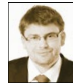
Jan Jakob starosta města Roztoky

Na konci dubna proběhlo konkurzní řízení na pozici ředitele/ky naší základní školy. Konkurzní komise doporučila pořadí čtyř uchazečů. O jmenování nového ředitele či nové ředitelky rozhodne rada města na svém jednání 11. května . Pevně věřím, že nový ředitel/ka se stane na své pozici stálíci a podaří se mu/jí školu stabilizovat a posouvat dál. S přáním hezkých dnů