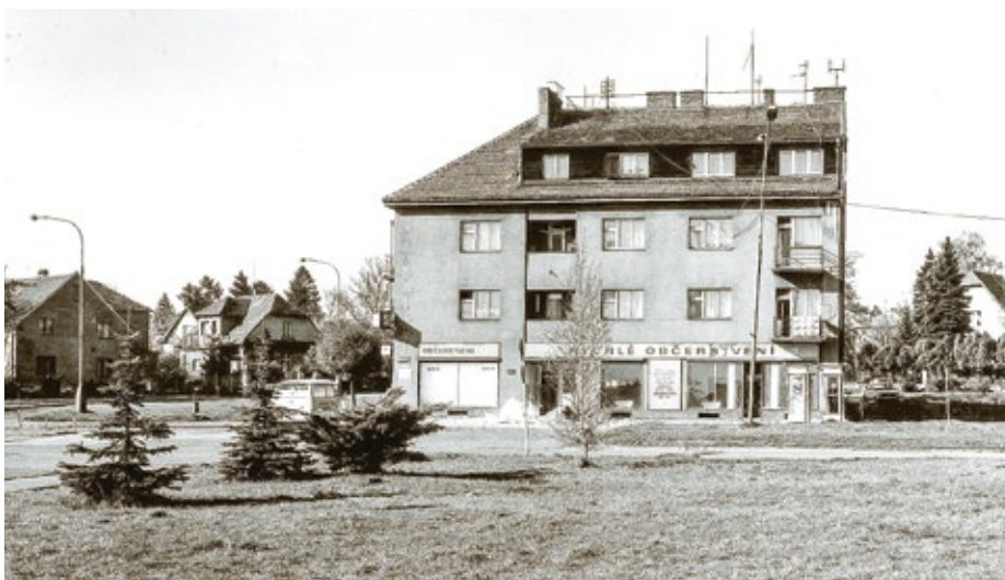
Tyršovo náměstí v roce 1991