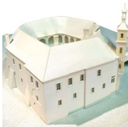
Hmatový model současné podoby zámku

tickými prvky jednotlivých časových období,“ přibližuje prvotní myšlenku vedoucí k realizaci projektu ředitelka muzea Zita Suchánková.