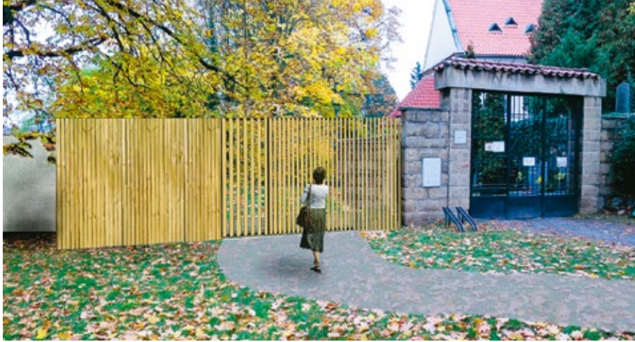
Vizualizace nové vstupní brány

V nejbližších dvou či třech letech dozná Levý Hradec, resp. bezprostřední okolí hřbitova, zřejmě největší proměnu za několik posledních desetiletí.