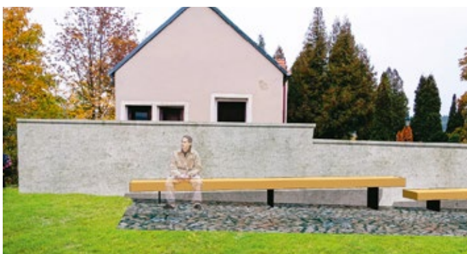
Vizualizace lavičky na vyhlídce