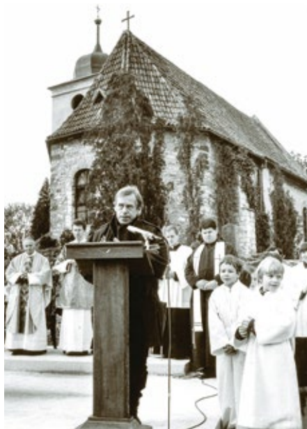
Václav Havel na Levém Hradci

Celospolečenské změny nepřímou vyvolaly i řadu sporů. Nejvýraznějším byl spor „Sokol versus Sokol“, kdy dosavadní uživatelé a správci majetku roztockého Sokola (dříve TJ Slovan Roztoky, nyní Sokol I) se dostali do konfliktu se zástupci „staroso-