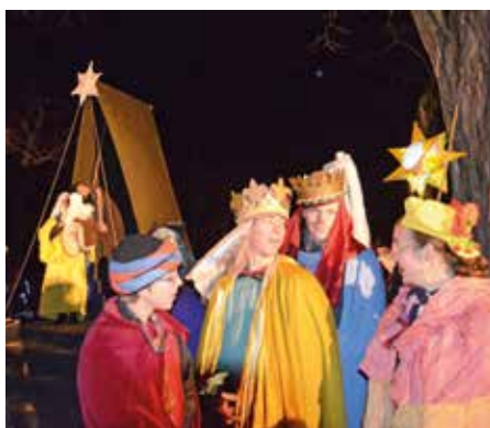
Nezbytnou součástí betlémské scény jsou také tři králové

Stalo se už tradicí, že v podvečer před Štědrým dnem nám sdružení Roztoč nabídne jímavý zážitek živých jesliček. Pro řadu lidí je to jediné setkání s projevem lidové vánoční zbožnosti, milým a zcela nekonzumním. Stalo se tak i letos 23. prosince na louce u kostela, a přestože jsme byli ochuzeni o ladovskou sněhovou kulisu, opět jsme si to krásně užili. Velká účast veřejnosti svědčí o úspěchu této akce. Jakkoli by se dal s lety očekávat určitý stereotyp, každý rok je zřejmě nějaké vylepšení, ať již v dramaturgii či v technice. Ježíška tradič-