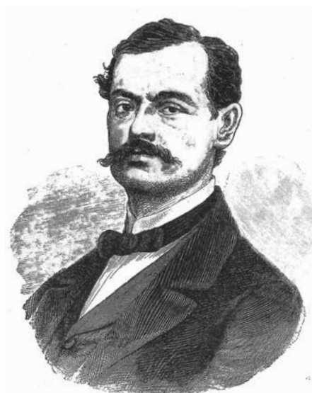
Hrabě Richard Belcredi, císařský místodržitel v Praze a rakouský ministerský předseda v letech 1865–1867, podporovatel českých autonomních zájmů v habsburské monarchii. V Praze na Letné byla po něm pojmenována hlavní třída, nyní Milady Horákové.

I další z těchto ústavních zákonů (č. 145/1867 ř. z.) nelze vnímat příliš pozitivně, byť je svým způsobem anekdoticky aktuální, neboť stavěl císaře nad ústavní systém tím, že Apoštolské Veličenstvo bylo i nadále posvátné, nedotknutelné a ze své funkce nikomu neodpovědné!