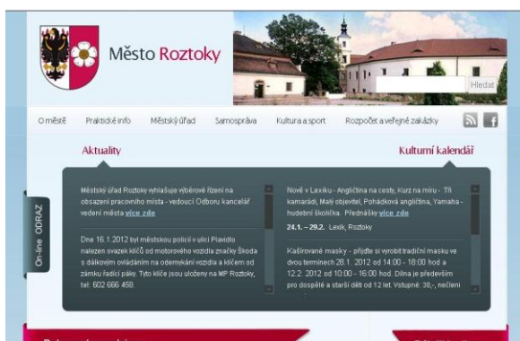
Nové webové stránky města Roztoky

Při projednávání přejmenování padl v diskusi návrh ze strany opozice, aby se přejmenovala ulice nová, kde zatím není žádné číslo popisné. Po přestávce se zastupitelé napříč politickým spektrem shodli a přejmenovali ulici Kuželovu na ulici Václava Havla. Protože Bohumil Kužel byl významný žalovský starosta (nyní část Roztok), přejmenována byla i ulice Baráčnická na Kuželovu.