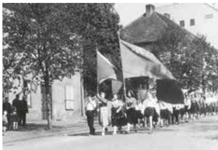
Prvomájový průvod v Nádražní ulici v Roztokách, 1960