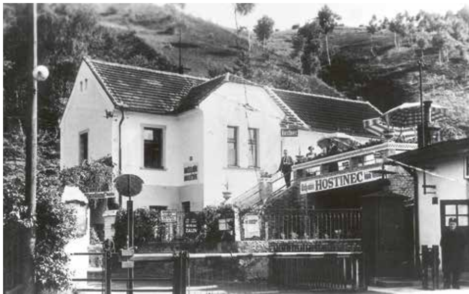
Restaurace u zastávky v Žalově, konec 30. let 20. století

Rok 1960 byl v naší republice ve znamení několika důležitých událostí.