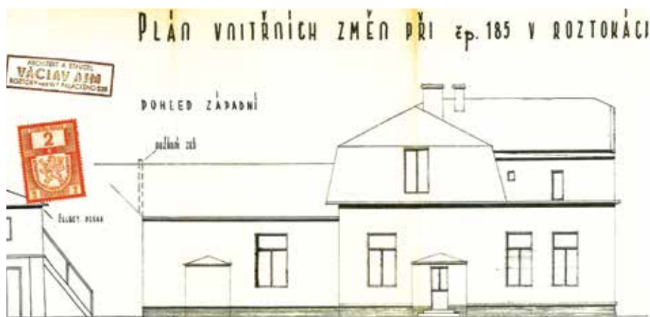
Vzhled domu čp. 185 ve čtyřicátých letech 20. století