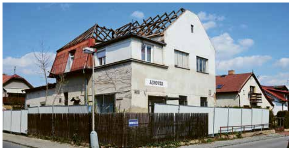
Objekt Ajmovky na začátku demolicie, v dubnu 2020