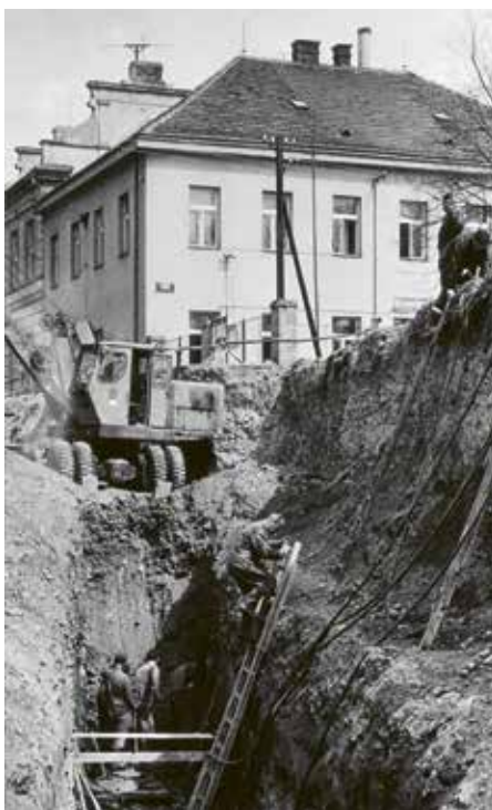
Budování kanalizace v Jungmannově ulici před MNV, 1960

Dne 10. června 1960 se na poslední schůzi sešla rada MNV v Žalově. Dva dny