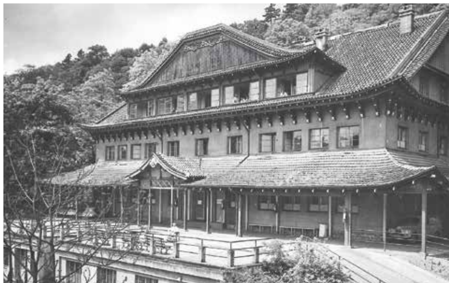
Okresní nemocnice „Sakura“, přelom 50. a 60. let

Kromě této změny politické, která nenápadně nastartovala liberálnější a dnes až oslavovaná šedesátá léta, došlo ve struktuře státu i k velké změně systémově organizační. Byly vytvořeny nové, velké kraje (řízené Krajskými národními výbory), nové okresy a také došlo k často direktivnímu slučování obcí a vytváření tzv. střediskových obcí. Když si odmyslíme ideologický balast této reformy územní samosprávy, šlo o opatření poměrně racionální – zejména pokud jde o krajskou strukturu (na rozdíl od současné). Náš dnešní pohled ale zkrlesluje velký rozvoj individuální dopravy, k němuž mezitím došlo, i nastupující digitalizace státní správy.