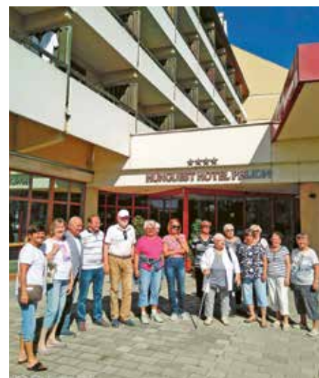
Zájezd SPCCH do Maďarska