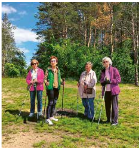
Vycházky po Roztokách

Pro podrobné informace volejte lektory dané aktivity.