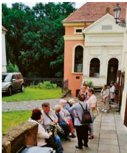
Výlet do Ústěku