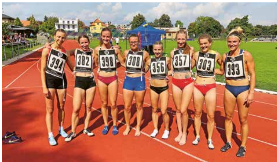
Finalistky běhu na 800 m

Oddíl atletiky TJ Sokol Roztoky – asistent hlavní trenérky