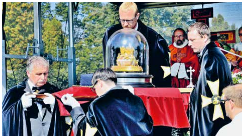
Svatoludmilská pouť na Levém Hradci, 15. září 2019