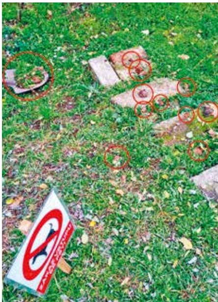
Ukázka množství výkalů na pouhých 2 až 3 metrech přístupové cesty

Bohužel se zejména posledních pár měsíců potýkáme s dalším problémem, který už jsme se rozhodli řešit touto cestou, a to bezohledností některých místních páníčků, kteří i přes zákaz vstupu se psy na pozemek neváhají pustit své psí mazlíčky do tohoto vznikajícího parku pro děti a mládež. Kdyby se tam každý týden válelo jen pár exkrementů, asi bychom to ani neřešili, ale ve chvíli, kdy se po celé přístupové cestě musíte v průběhu jednoho týdne