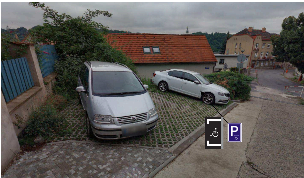
Obr. č.5 - IP12+O1 + VDZ V10f