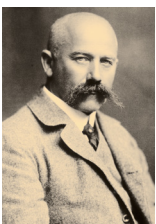
JOŽA UPRKA, (1861 Kněždub – 1940 Hroznová Lhota) malíř, grafik, folklorista a estetický impresionista

(Zdenka Anně Bourges, Paříž 13. 1. 1891, fond Z. B., LA PNP)