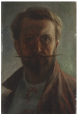
ANTONÍN CHITTUSSI, (1847 Ronov n. Doubravou – 1891 Praha) akademický malíř – krajinář

Považuj celou svou malbu prozatím za svou nejmilejší zábavu, bav se s tou milou přírodou. [...] hled', aby tě malba bavila a nikoliv odstrašovala a nešťastnou činila.