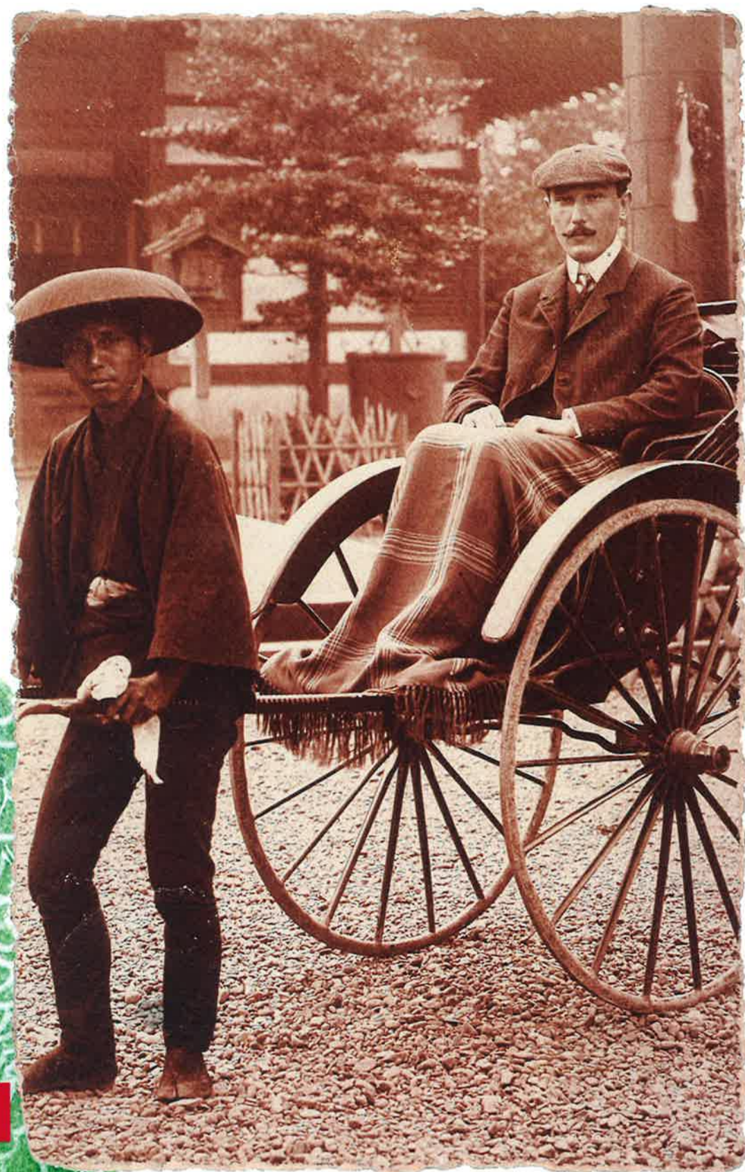
foto: Joe Hloucha v Japonsku, archiv Středočeského muzea v Roztokách u Prahy kresba: Dorota Langová, Drak, štít Hlouchovy vily v Roztokách malba: Adéla Sazimová, Jeřáb